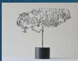
阿部 典英 彫刻・絵画展

場 所：1階ビッキアトリエ チケット：700円（50席限定） 取り扱い：水の駅・洞爺湖芸術館