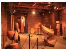
砂澤ビッキ彫刻作品