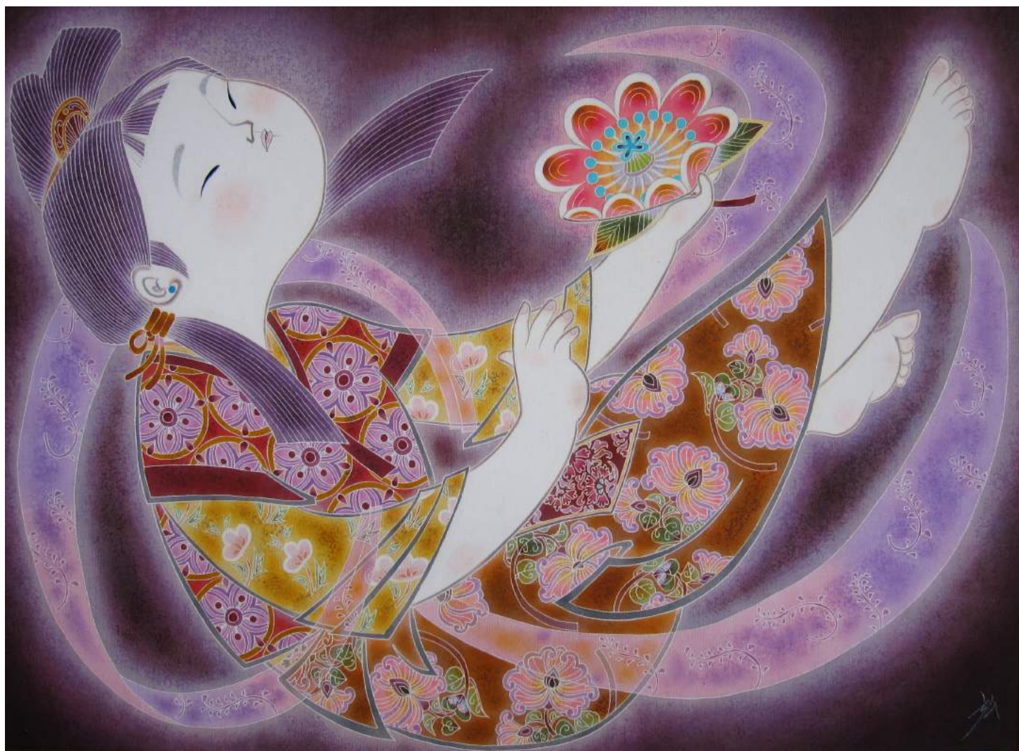
友禅染絵「この哀しみに」