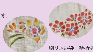
刷り込み染 絵柄例