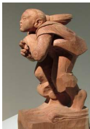
木彫「天翔る」志田 哲夫