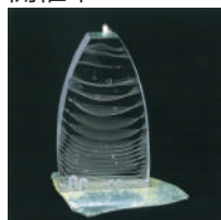
コレクション企画 「私の好きな作品展」