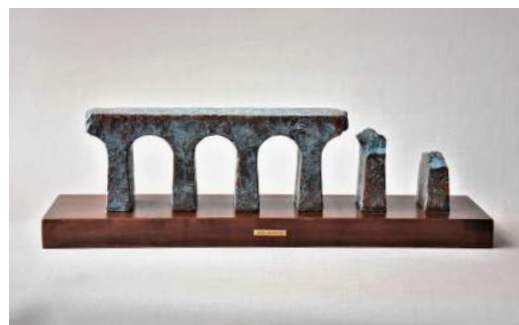
「刻の架け橋」2016年制作