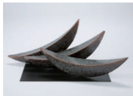
望月 建 金属造形展