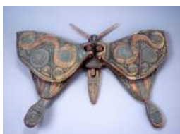
コレクション企画 「神々の遊ぶ庭」